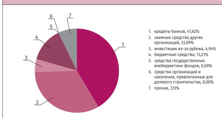
РИСУНОК 1. Структура привлеченных средств инвестиций в основной капитал

При этом удельный вес бюджетных средств , а точнее средств федерального бюджета, составил 13,21%, или 554,996 млн руб. Необходимо отметить, что за отчетный период предприятиями отрасли вообще не привлекались в качестве инвестиций в основной капитал кредиты иностранных банков, средства государственных внебюджетных фондов, средства местных бюджетов и бюджетов субъектов РФ, а также организаций и населения, привлеченные для долевого строительства.