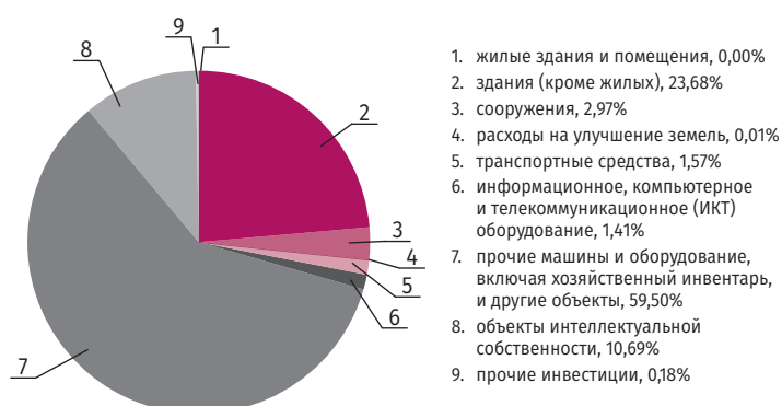
РИСУНОК 3. Структура использования инвестиций в объекты интеллектуальной собственности