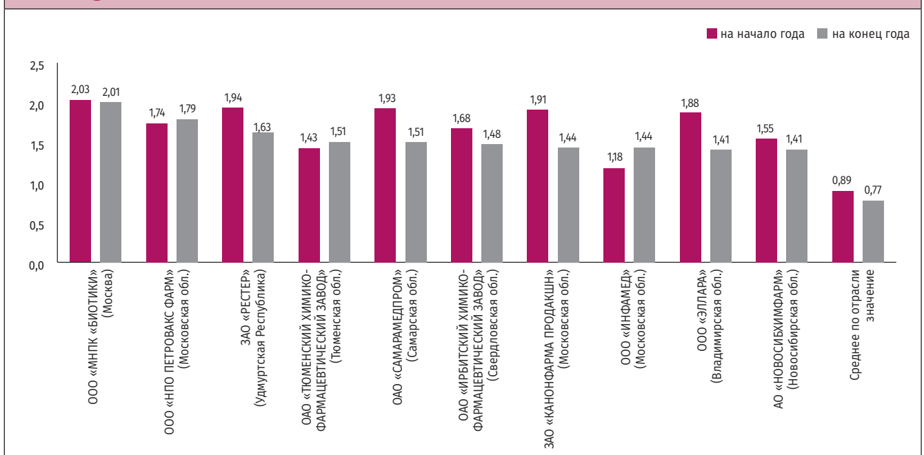
РИСУНОК 1 Динамика коэффициента оборачиваемости активов на начало и конец года по топ-10 предприятиям