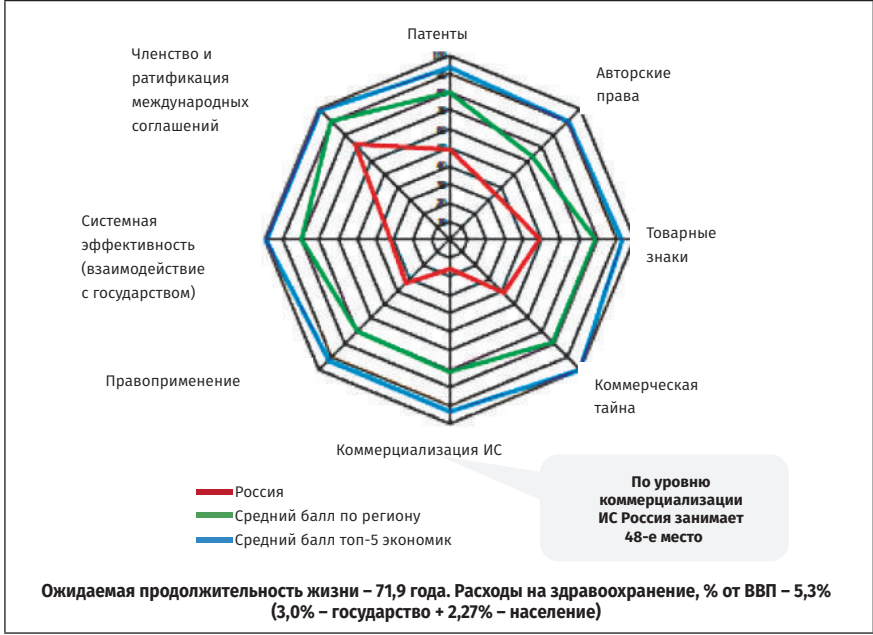
РИСУНОК 2 Рейтинг 29/50